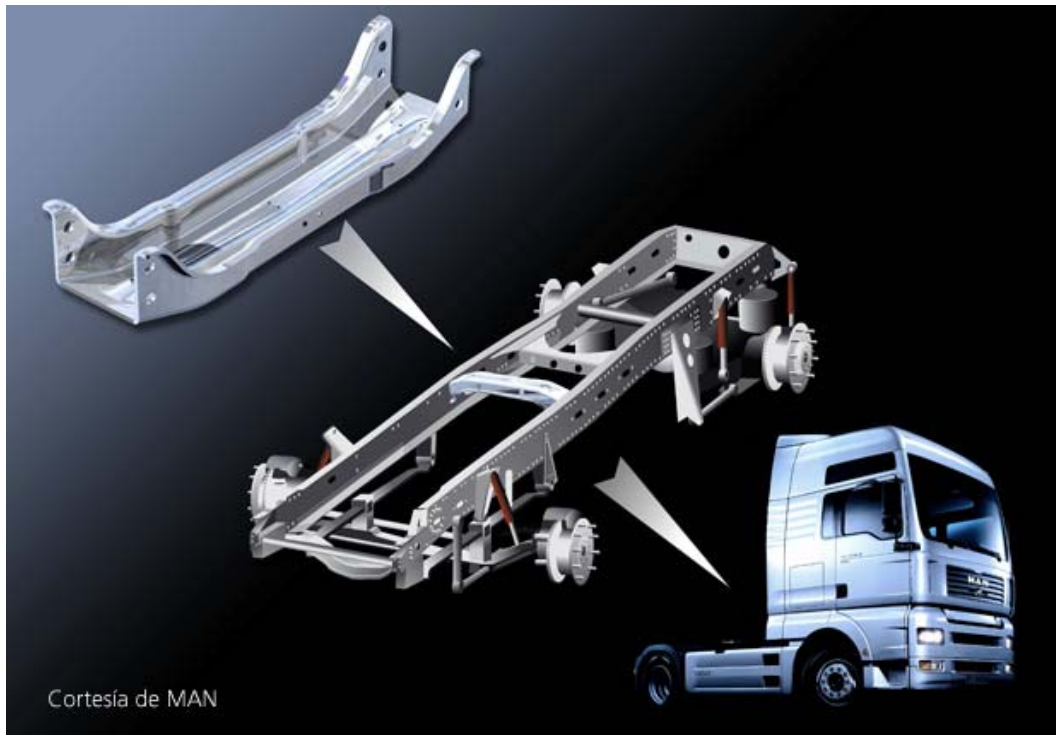
Refuerzo de chasis